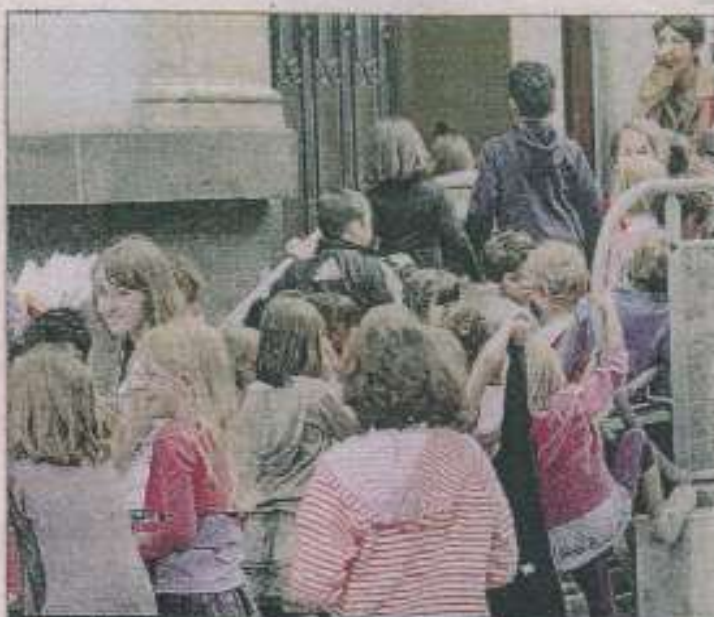
RENTREE. Placée sous de meilleurs auspices ? À tout le moins un mieux qui ne lève cependant pas toutes les interrogations.

La directive prise à l'issue du Conseil des ministres du 30 mai est bien loin de combler le déficit enregistré mais au moins a-t-elle la vertu de redessiner une carte scolaire du